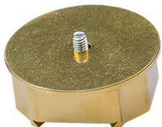
11-000574 JV70 dovetail