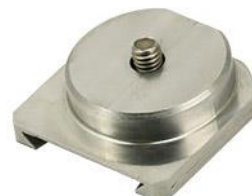
11-000554 JV50 dovetail