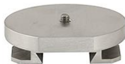
11-000564 JV60 dovetail