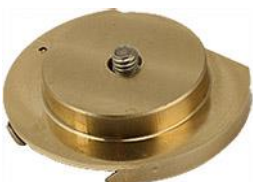
11-000554 JV35 dovetail